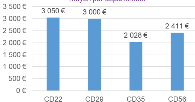
Montant de la subvention moyen par département