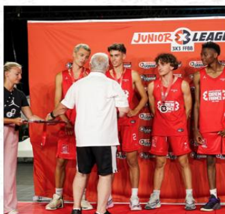
MACADAM 3X3 (RENNES)